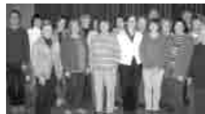
Die Teilnehmer am Besuchsseminar

Durch offene und ehrliche Kommunikation ist jede(r) über die Ziele und Aktivitäten der Arbeitskreise informiert; mit diesem Wissen können viele Menschen in das gemeinsame Boot geholt werden.“