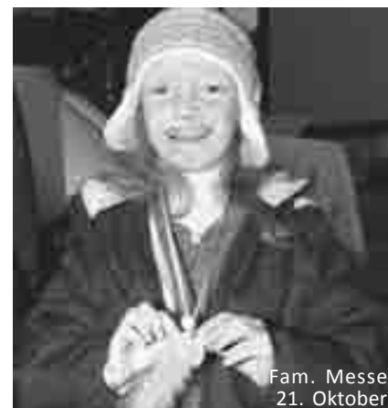
Fam. Messe 21. Oktober

Einmal im Monat trifft sich ein Team im Pfarrhof um die Familienmesse vorzubereiten.