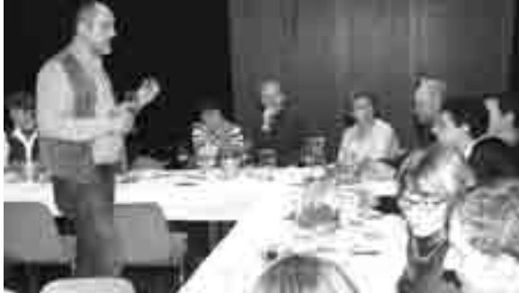
Weinliebhaber oder solche die es werden wollen - im Pfarrzentrum OASE

war das Motto vom 17. Jänner im Pfarrzentrum OASE