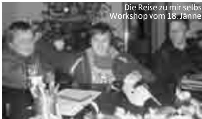
Die Reise zu mir selbst Workshop vom 18. Jänner

„Wo zwei oder drei in meinem Namen versammelt sind, da bin ich mitten unter ihnen“