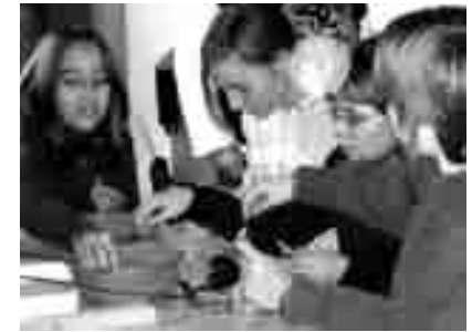
Jungscharkinder beim Basteln

In unserer Dezemberstunde bastelten die Jungscharkinder für den heurigen Adventbasar.