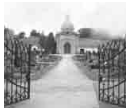
Friedhof der PFARRE YBBS