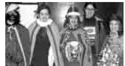
18 Gruppen ersangen 6337,55

50. AKTION DREIKÖNIGSSINGEN 2008 Sternsinger für Eine Welt