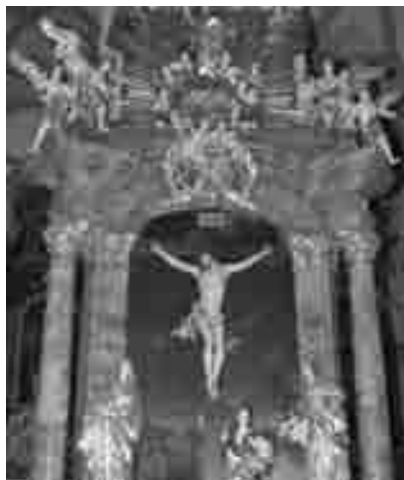
Der Kreuzaltar aus dem Jahre 1720

Der Kreuzaltar stammt aus dem Jahre 1720, wie uns die Inschrift auf dem zweiteiligen Wappen oberhalb der Kreuzigungsgruppe anzeigt. Er wurde nach dem großen Brand im Jahre 1716, bei dem die Kirche vollständig ausbrannte, von Chrisostomus Wening von Greifenfels gestiftet. Dieser Altar wurde zu Ehren des Hl. Kreuzes, so wie auch der Hochaltar und der Marienaltar, am 4. Juli 1722 vom Passauer Weihbischof Johann Raimund Graf von Lamberg geweiht. Bei dieser Weihe wurden in der Altarplatte die Reliquien der heiligen Märtyrer Justa, Desiderius und Placidus hinterlegt. Der Altartisch ist gemauert, die Platte aus Stein und die Verkleidung aus marmoriertem Holz. Die Reliquienplatte ist nicht mehr vorhanden. Im Mittelpunkt des Altares steht die Kreuzigungsgruppe mit Jesus am Kreuz, zu seinen Füßen kniend Maria Magdalena, links stehend die Mutter des Herrn und rechts vom Kreuz Johannes, sein Lieblingsjünger. Im Hintergrund ein Tafelbild, darstellend Jerusalem, gemalt auf Holz. Diese barocke Darstellung wird umrahmt von zwei bunt marmorierten Säulen und zwei kantigen Pfeilern. Unter dem Kreuz sind als Opfersymbol ein Kelch und ein Totenkopf, der früher einmal vergoldet war und der den Kopf Adams dar-