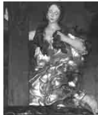
Heilige Maria Magdalena - 22. Juli

Maria von Magdala wurde durch Jesus von ihrer Besessenheit geheilt. Sie begleitete ihn dann als seine Jüngerin durch ganz Galiläa und diente ihm. Sie stand ihm treu zur Seite, selbst als er ans Kreuz geschlagen wurde.