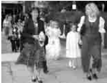
Die Klassenlehrerinnen mit den Erstkommunikanten beim Auszug aus der Volksschule