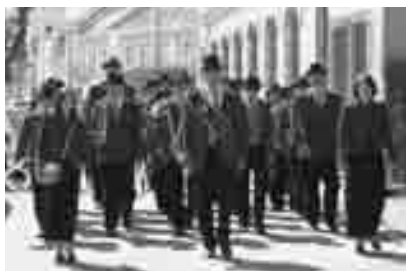
Die Blasmusik begleitet die Kinder beim Festzug in den Pfarrgarten