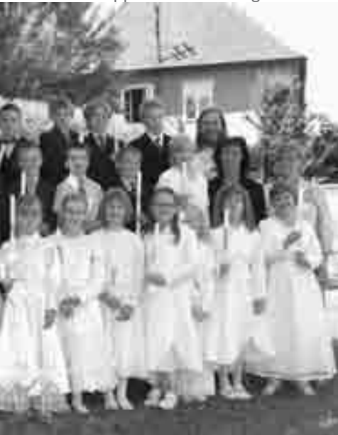
und 2b beim Gruppenfoto im Pfarrgarten