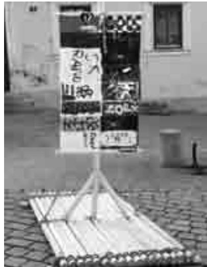
Motto: „Bewegung schafft Begegnung“

46 Kinder begaben sich heuer auf Expedition um das Wirken des Hl. Geistes in ihrem eigenen Leben zu spüren.