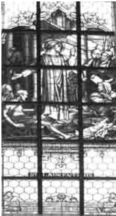
Auf der Nordseite der Kirche, vorne beim Sebastianaltar, das Glasfenster mit dem Hl. Franziskus

In unserer Kirche befinden sich 5 farbige Glasfenster.