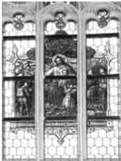
Über dem Seiteneingang: Das kleinere Glasfenster darstellend Jesus als Freund der Kinder .